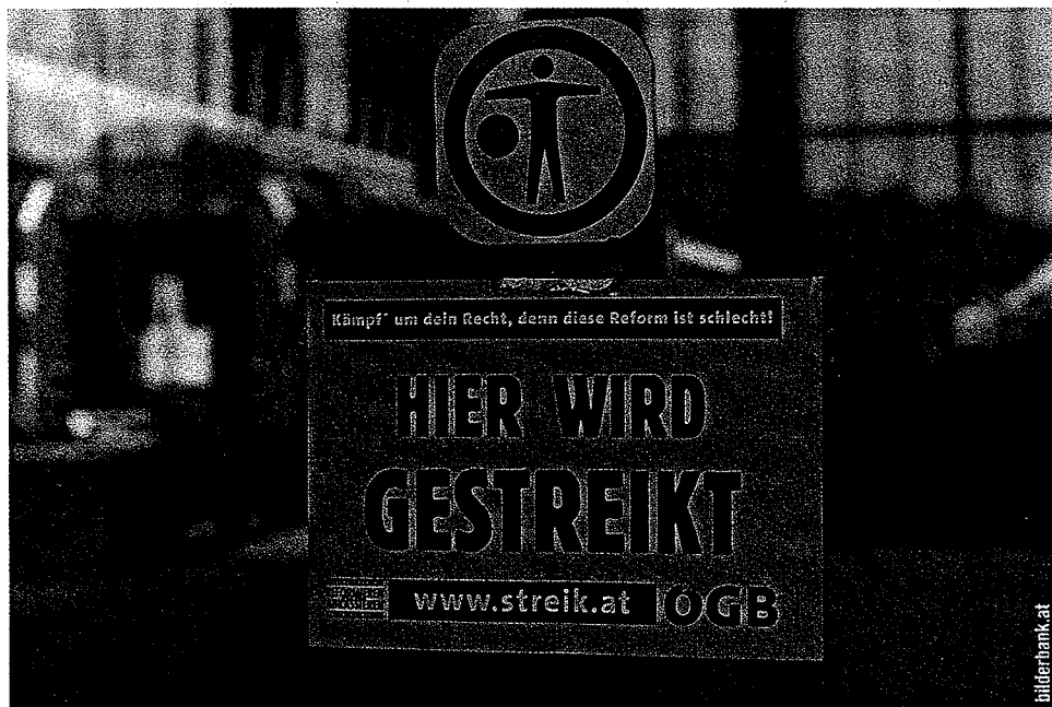
Die Eisenbahner haben Ende 2003 drei Tage für die Erhaltung ihres Dienstrechtes gestreikt. Erfolgreich. Danach hatte die Regierung weitere gesetzliche Änderungen des Dienstrechts praktisch ausgeschlossen.

mit dem Bundesbahnpensionsgesetz in Gesetzesrang erhoben, ohne mit der GdE zu reden. Teile dieses Dienstrechts sind Gesetz und können so mit einfacher Mehrheit geändert werden. Wenn sich die Regierung also aufregt, dass das ÖBB-Management Frühpensionierungen durchführe, dann bräuchte sie nur das Gesetz aufzuheben. Dazu hat sie die Möglichkeit. Die Frühpensionierungen haben somit nichts mit dem jetzt von Vizekanzler Gorbach ins Spiel gebrachten Kündigungsschutz zu tun. Das ist bloß politischer Populismus, um die Eisenbahner als Verhinderer hinzustellen.« Den Kündigungsschutz wiederum gibt es deshalb, weil die ÖBB ein Monopol als Arbeitgeber hat: »Woanders als bei den ÖBB kann z. B. ein Lokführer nicht arbeiten, wenn er von den ÖBB gekündigt wird. Deshalb sind wir gegen die Aufhebung des Kündigungsschutzes, deswegen werden wir uns dagegen mit allen Maßnahmen bis hin zum Streik wehren«, so Haberzettl.